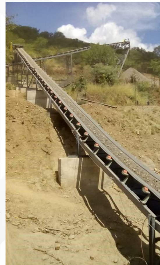
来自XRT分选机的皮带输送机