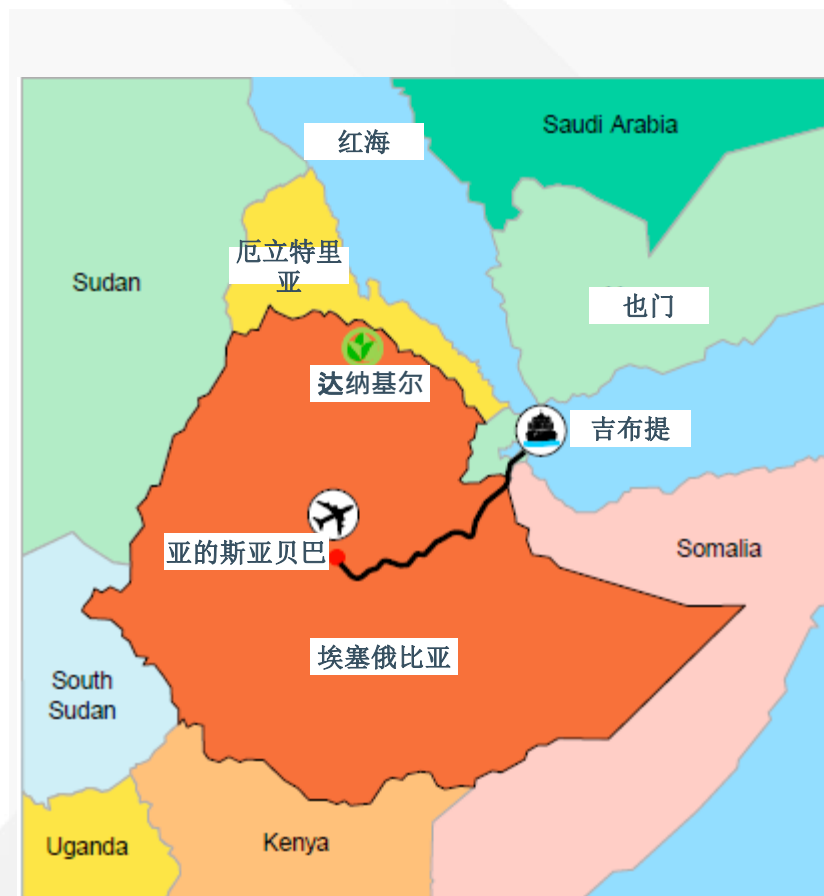
达纳基尔项目位置