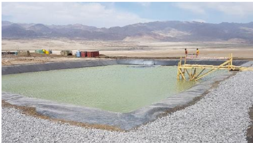
钾盐镁矾岩蒸发池