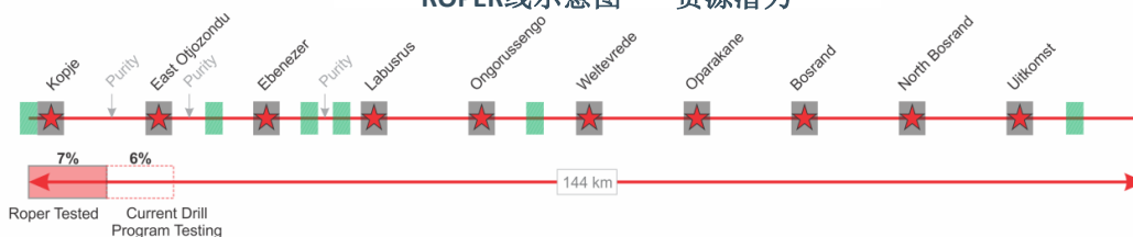
ROPER线示意图——资源潜力